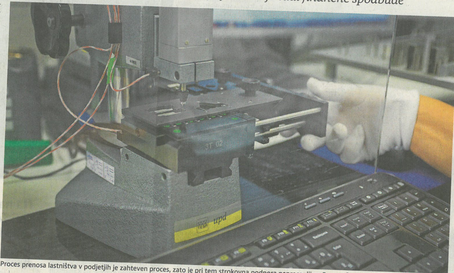
Proces prenosa lastništva v podjetjih je zahteven proces, zato je pri tem strokovna podpora neprecenljiva.

»Do vavčerja so upravičena vsa mikro, mala in srednje velika podjetja, ki razmišljajo, se pripravljajo